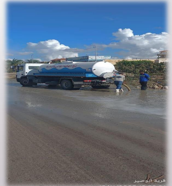
قرية أبوصير 13/11/2025 13:53:21