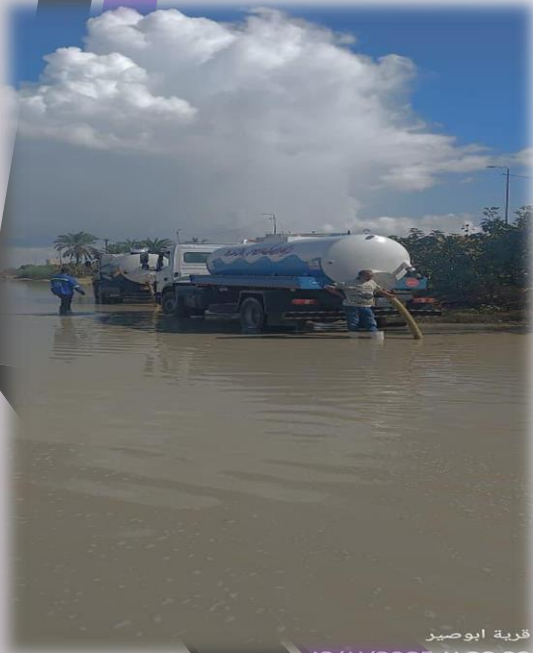
قرية أبوصير 13/11/2025 11:33:33