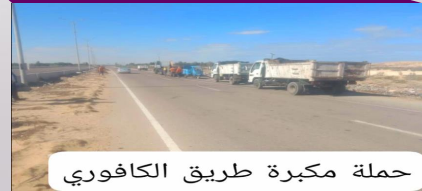
حملة مكبرة طريق الكافوري